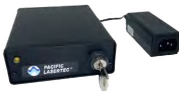
ユニバーサル入力電源