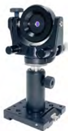
高精度ジンバルマウント