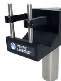
堅牢なレーザーマウント